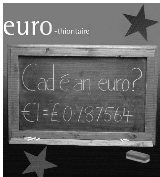
From a poster by the Euro Changeover Board of Ireland

Se il testo dell' Acht sopra citato parlasse del pound e del penny, o del dollaro e del cent, dovremmo aspettarci sa phunt agus sa phingin , o sa dbollar agus sa cheimt . Se il testo fosse fedele all'originale inglese (immaginando un originale inglese con le dovute forme plurali), dovremmo avere i bpuint agus i bpingine o ndollair agus i gceinteanna . Questo implica che, con l'euro, dovremmo avere in eoraí (o in eorónna ) agus i gceinteanna .